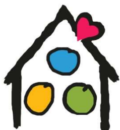
Obrázok 1 Logo CZŠ Jána Krstiteľa

Poslanie a základné piliere CZŠ Jána Krstiteľa vyjadruje aj logo školy, ktoré symbolizuje obrázok 1.